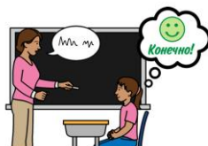
Если учительница просит меня что-нибудь сделать, я отвечаю: "Конечно!" и делаю то, о чём она попросила