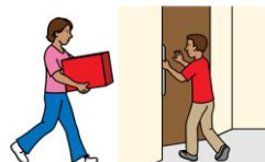
Если я вижу, что учительница несёт что-нибудь тяжёлое, я спрашиваю: "Могу ли я помочь вам чем-нибудь?" Если учительница хочет зайти в кабинет, я открываю перед ней дверь